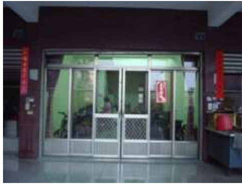
(一)喜樂1家~二林鎮後厝里斗苑路4段208巷9號