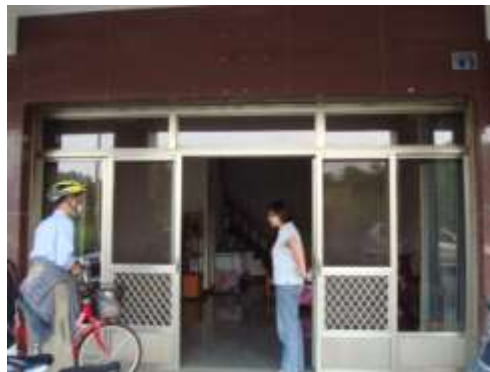
(二)喜樂2家~二林鎮後厝里正知二街3號